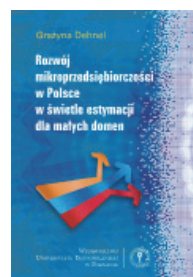
Grażyna Dehnel, Rozwój mikroprzedsiębiorczości w Polsce w świetle estymacji dla małych domen