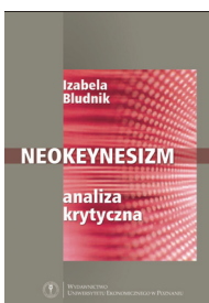
Izabela Bludnik, Neokeynesizm